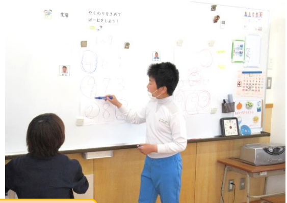
ビンゴでボウリング！