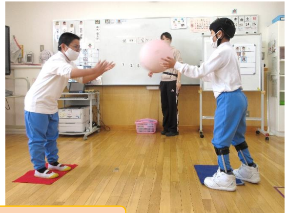
UFO キャッチャー・キャッチボール