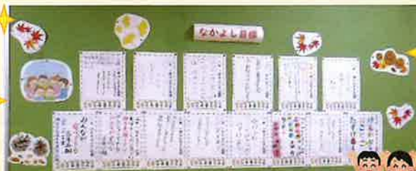
「なかよし目標」の掲示