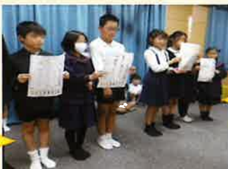
「なかよし目標」発表の様子

このような児童一人ひとりの人権意識をより高める取組を今後も続けていきたいと思えます。