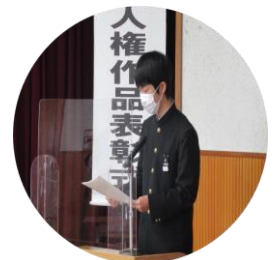
▲作品に込められた「思い」の発表