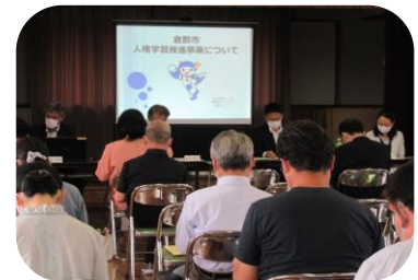
▲ 今年度の総会の様子

6月5日(日)、令和4年度西中学校区人権学習推進委員会総会を倉敷西公民館で開催しました。一昨年と昨年は、新型コロナウイルス感染症拡大防止のため、対面での総会は中止し、書面による表決という形をとりました。しかし今年度は、感染対策を徹底し、推進委員、教育委員会関係者など38名の参加を得て、2年ぶりに対面による総会を開催することができました。