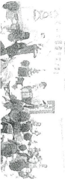
クリスマス会のようす