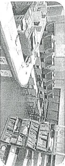
西ビル教室のなか