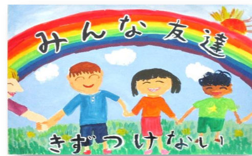
琴浦西小4年 長尾 謙太郎