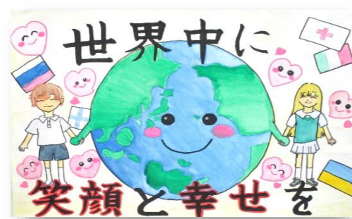
琴浦東小6年 大西 紗菜