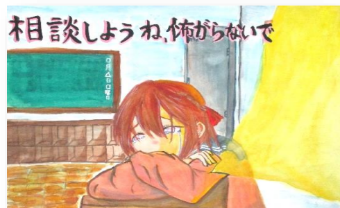
琴浦西小6年 大橋 奏