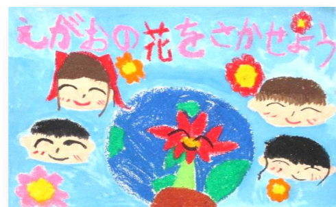
琴浦南小2年 大森 凜