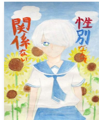
琴浦南小6年 江島 優衣