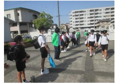
あいさつ運動の様子（5月10日）

琴浦南小学校PTAの方は、毎月2回（主に10日と25日）にあいさつ運動をしてくださっています。また、自主的に校門であいさつを呼びかける子ども達もどんどん増えてきています。「あいさつの輪」が広がって、気持ちのよい一日のスタートになっています。たくさんの方々が、あいさつ運動にご協力をしてくださり感謝の気持ちでいっぱいです。