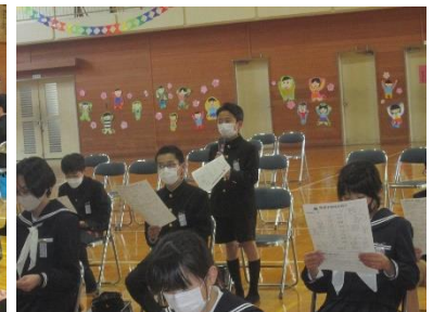
「中学校生活 Q&A」の様子