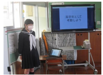
「なかよし学級引継ぎ会」の様子