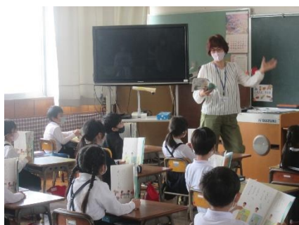
参観授業様子（1年1組）