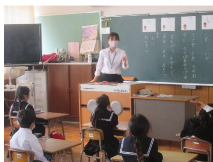
参観授業様子（1年2組）