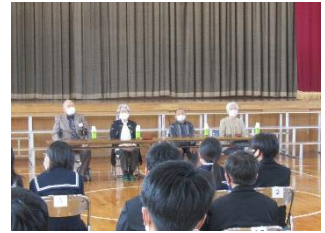
原爆語り部の会の様子

11月19日（金）に「原爆語り部の会」が行われました。原爆被害者の会児島支部から4名の方をお招きして、6年生の子ども達に原爆の被害の体験を話していただきました。子ども達は、「戦争は絶対にあってはならない」という気持ちを強くもちました。お話をいただいた方への子ども達のお手紙の一部を紹介します。