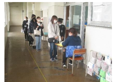
引き渡し訓練の様子

「災害時の児童引き渡し訓練」を実施しました。本来は、6月の土曜授業参観日に計画していましたが、感染症対策のため参観日も中止となり、11月10日（水）に行いました。最近の異常気象からも「災害時の児童引き渡し訓練」はとても大切です。ご多用の中、ご協力ありがとうございました。