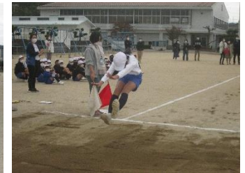
校内陸上記録会の様子