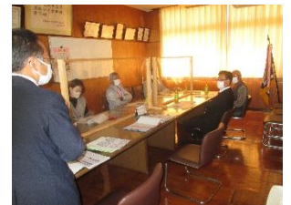
学校評議員会の様子

11月4日（木）、第3回学校評議員会を行いました。学校評議員の方々に、学校運営に関するご意見やご指導をいただいたり、参観授業の様子を観ていただいたりしました。「落ち着いた雰囲気、授業が行われている。」と仰っていただきました。