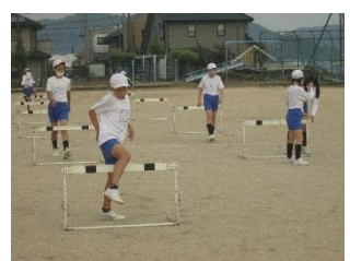
陸上記録会に向けての練習の様子