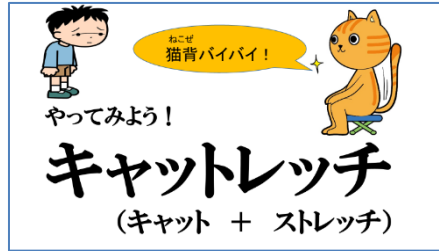
猫背を防ぐ「キャットレッチ」