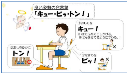
良い姿勢の合言葉

11月1日（月）の朝の時間に、「良い姿勢」についてテレビ放送をしました。「進んで良い姿勢をしよう」と題して、良い姿勢について保健委員会の子も達が分かりやすく説明してくれました。「良い姿勢の合言葉」や猫背を防ぐ「キャットレッチ」について学びました。ご家庭での話題の一つにしていいただければと思います。