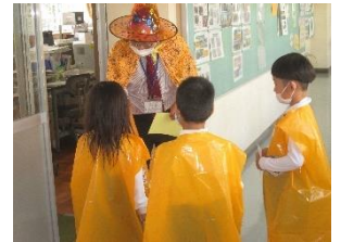
ハロウィーンラリーの様子

11月1日（月）2校時に1・2年生が「ハロウィーンラリー」を行いました。「ハロウィーンラリー」とは、3～4人のグループで、ジャコランタンの提灯のある部屋をじゃんけんをしながら巡っていくものです。子ども達は、自分で作った衣装を身にまとい、楽しく外国の文化に触れることができました。