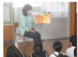
読み聞かせの様子

10月20日(水)に、今年度初めての「読み聞かせ」を行いました。今年度も、水曜日の朝の時間に、ボランティアの方が「読み聞かせ」をしてくださる予定です。学校中が、静かに物語の世界に浸り、とてもよい時間が流れました。