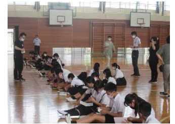
通学班長会の様子

7月5日（月）に通学班長会を行いました。1学期の登下校の様子を振り返りました。さらに、安心して通学できるように、安全な登校の仕方について話し合いました。毎日、下級生のお世話をしてくれている通学班長の子ども達には、感謝の気持ちでいっぱいです。