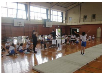
マット運動発表会の様子