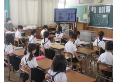
テレビ放送（給食）の様子