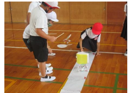
生活科の学習の様子