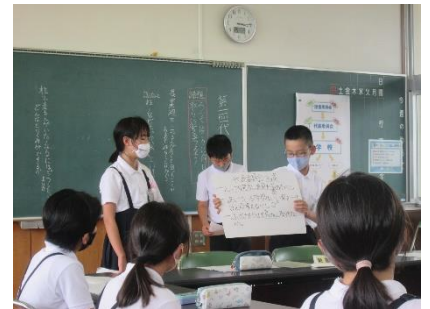
代表委員会も様子