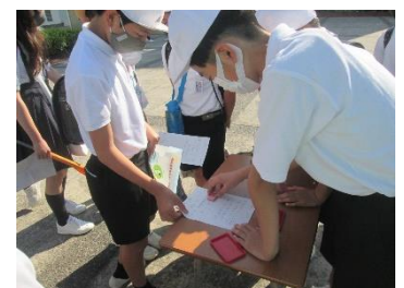
カードにスタンプを押している様子

「校長室便り No.10」で、運営委員会の「先言後礼」のあいさつの呼びかけの様子を紹介しました。そして、さらに「あいさつ輪」を広げようと、「あいさつスタンプカード」を使って取り組んでいます。子ども達の姿をととても頼もしく思います。