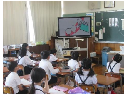
健康教室（朝のテレビ放送）の様子

「一生をともに歩む 自分の歯」をテーマに、全国では6月4日（金）から10日（木）までを「歯と口の健康週間」としています。琴浦南小学校では、5月31日（月）から6月6日（日）までを「歯と口の健康週間」として、「健康教室（朝のテレビ放送）」、「はみがきがんぱりカード」などの取り組みを行います。今年の目標は、「みがき残しやすい場所を注意してみがこう」です。ご家庭でも、是非、「歯と口の健康」について、話し合ってみていただければと思います。