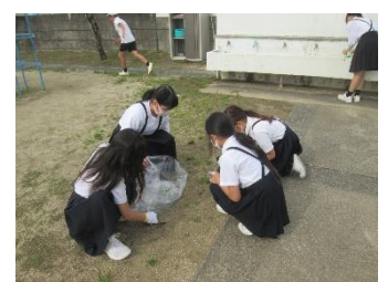
自主的に草抜きをしている子どもたちの様子