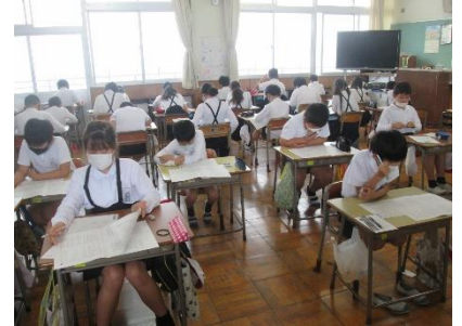
学力・学習状況調査の様子

5月27日（木）に学力・学習状況調査を行いました。3～6年生の子ども達が、国語と算数の問題に取り組みました。学力・学習状況調査は、「子ども達一人一人の学習状況を把握して、今後の学力保障や学習指導に生かすこと」を目的に行われています。子ども達の真剣に取り組んでいる表情がとても印象的でした。5年生の算数の問題を紹介します。