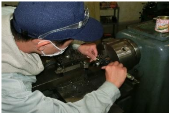
機械科の実習風景