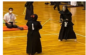
部活動全国大会 R3年出場 剣道同好会