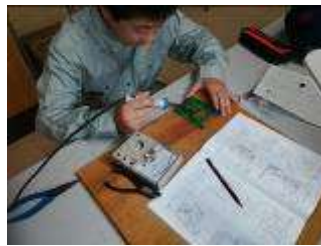
電気科の実習風景