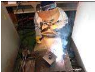
機械科の実習風景