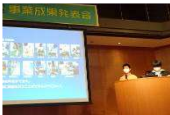
高梁川流域未来人材育成事業 成果発表会