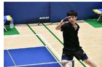
部活動全国大会 卓球部 R元年出場