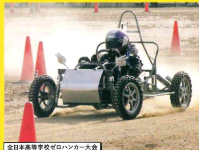
全日本高等学校ゼロハンカー大会