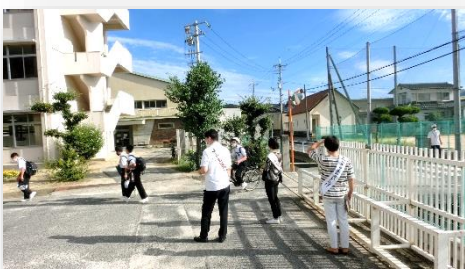
◇青少年を育てる会あいさつ運動

青少年を育てる会の地域の方が、生徒の登校を見守り、あいさつで迎えていただきました。その後、全学年課題テストに取り組みました。3年生にとっては、進路決定に向けて重要な時期に差し掛かります。毎日の学習の積み重ねを大切にしてもらいたいと思います。