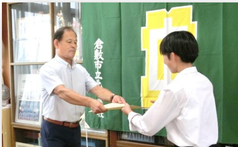
◇表彰状を授与される生徒の様子

もらいました。しかし、社会情勢は厳しく、コロナ禍に翻弄されている状況ではありますが、北中学校として、この難局を切り抜けていかななくてはという思いを強くしました。引き続き、感染症対策をとりながら生徒の活動する機会を工夫しながら確保していきたいと考えています。ご理解ご協力の程、よろしくお願いいたします。