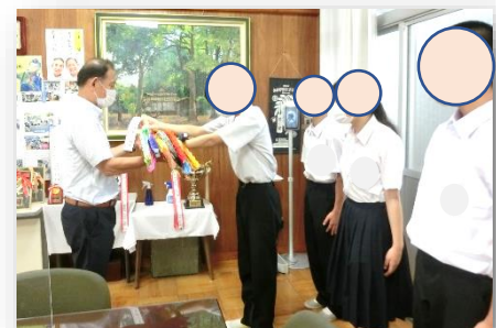
◇ボランティア委員会の代表メンバー