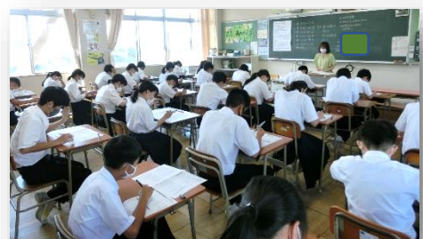
◇課題テストに取り組む生徒の様子

青少年を育てる会の地域の方が、生徒の登校を見守り、あいさつで迎えていただきました。その後、全学年課題テストに取り組みました。3年生にとっては、進路決定に向けて重要な時期に差し掛かります。毎日の学習の積み重ねを大切にしてもらいたいと思います。