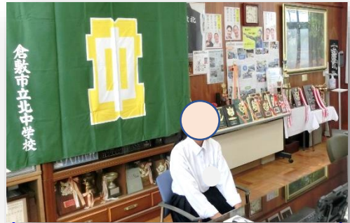
◇2学期始業式生徒会執行部からの話

3年ぶりに行動制限のない夏休みも終わり、2学期がスタートしました。自分を成長させる充実した生活を送ることができたのではないかと期待しています。夏休み中には、運動部・文化部をはじめ多くの生徒が、様々な大会やコンクール・発表会において、実力を発揮し活躍してくれました。その躍動する姿から、たくさんの感動や活力を与えて