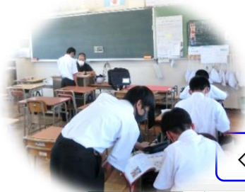
◇放課後補充学習の様子