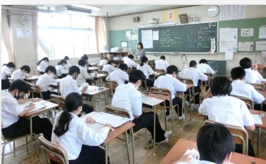
◇緊張の面持ちでテストに臨む1年生

2日間、全学年において1学期期末テストを行いました。3年生は、進路決定に向けて真剣さが増してきました。2年生は、家庭学習の成果を確認しました。1年生は、初めての定期テストなのでテストの受け方の説明をもらい、緊張した面持ちでテストを受けました。