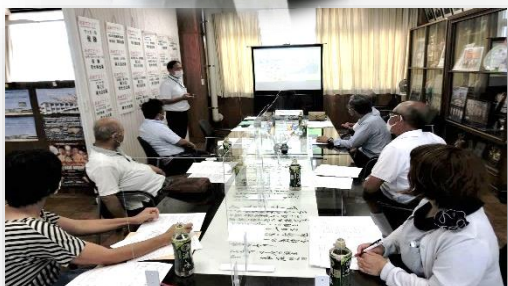
◇第1回学校評議員会