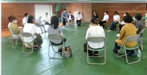
◇課題別研修会の様子