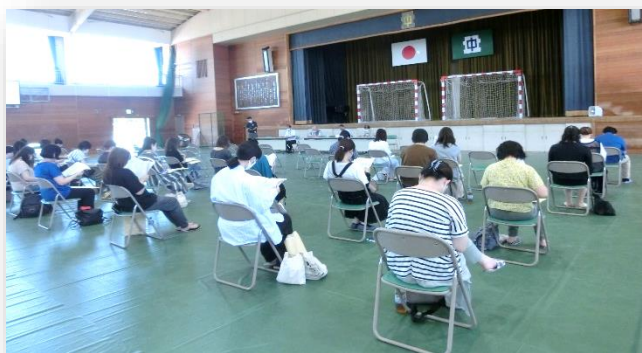
◇北中後援会 総会の様子

北中後援会総会を開催しました。この後援会は、昭和44年7月に発足した歴史ある会です。各地区の常任理事の方が、各家庭を回って会費を北中学校生徒のために集めてくださっています。毎年、部活動をはじめ生徒の活動のために、多大な援助をいただいています。地域に支えられていることに心より感謝申し上げます。