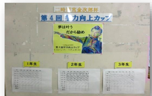
◇学力向上カッパの集計表

1学期期末テスト前の期間を設定し、家庭学習時間の充実を目的として、クラスマッチ形式で学力向上に取り組みました。各学年、第1位のクラスには、賞状と優勝カップを授与する予定です。この取り組みを継続することで、家庭学習の習慣が定着してくれることを期待しています。