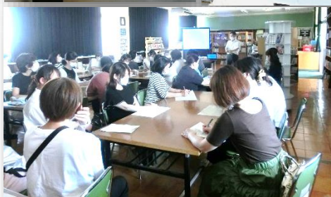
◇授業参観・ 学年懇談会の様子