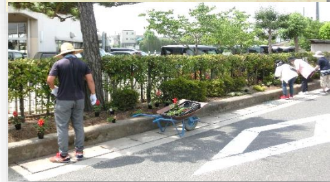
◇花植えボランティアの様子