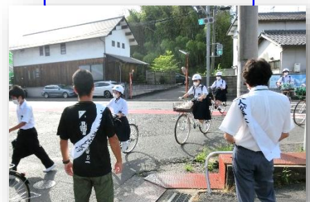
◇あいさつ運動の様子

PTA 育成・研修部の方にご協力いただき、4日間の日程で、生徒の登校の様子を見守ってもらいました。学区には交通量の多い道路や狭い通学路もあり、危険箇所も多数あります。あいさつを交わしていただくとともに、交通安全も呼びかけていただきました。