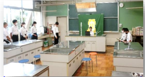
◇オンラインによる生徒総会の様子

本年度も、コロナ禍の影響で集会形式の総会ではなくオンラインによる生徒総会を実施しました。前日のリハーサル通りに会の進行を行うことができました。内容は生徒会執行部からの昨年度の生徒会活動の総括・生徒会費の決算報告、本年度の各委員会の活動方針・計画の説明、予算案の提案がありました。より良い北中学校になるために、生徒が主体的な活動に取り組んでくれればと期待しています。企画・準備をしてくれた生徒会執行部のみなさんお疲れさまでした。