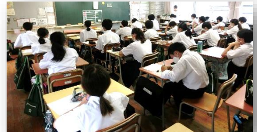
◇真剣に取り組む生徒の様子

第1回『基礎・基本力コンクール』を実施しました。小中連携事業の一環で、菅生小・中庄小の5・6年生と、北中生全学年が参加し、取り組みました。今回は、漢字・言葉編ということで練習問題の中から出題されました。中学生は小学生に負けじと真剣に取り組み、結果を気にしている様子でした。どんな結果が出るか楽しみです。日頃の学習にもいい効果が表れてくれればと思います。