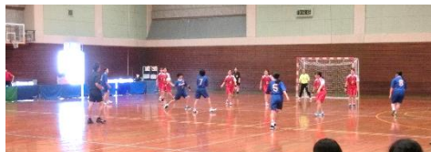
◇備南東地区総体の熱戦の様子