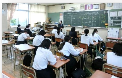
◇各係の打ち合わせの様子

体育会予行の前には、各係で入念な打ち合わせをして、本番に向けて備えました。その努力の積み重ねが、成果として表れました。また、体育会の練習と並行して、各クラスの応援幕の制作にも熱がこもっていました。体育会当日は、会場の雰囲気づくりに彩を添えてくれました。