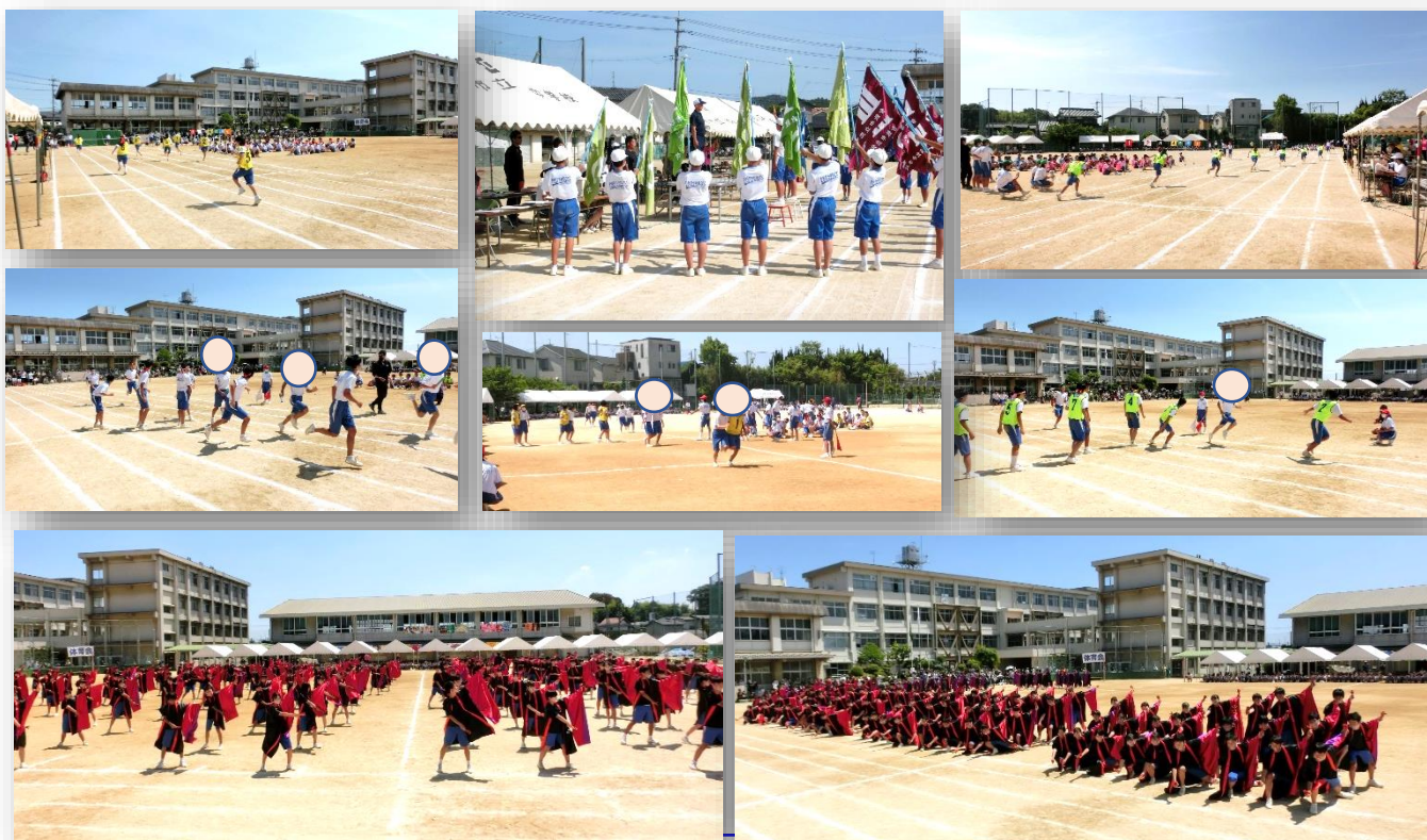
◇体育会の競技・演技の様子