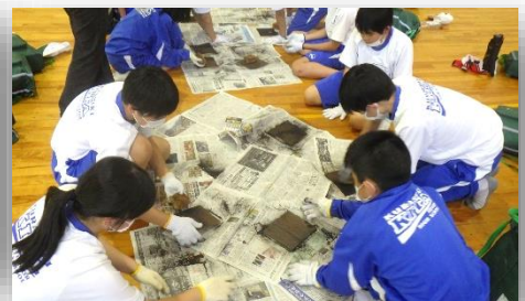
◇自然教室の生徒の活動の様子