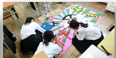
◇応援幕制作の様子