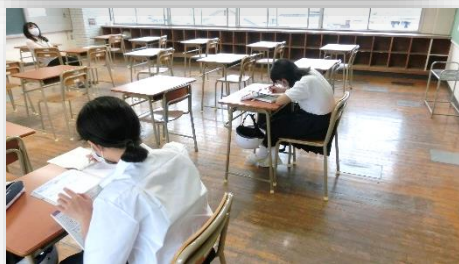
◇『まなびのま』での学習の様子