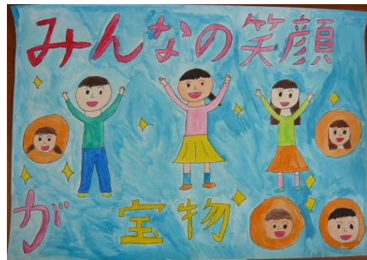
③ なかよしいっぱいクイズ