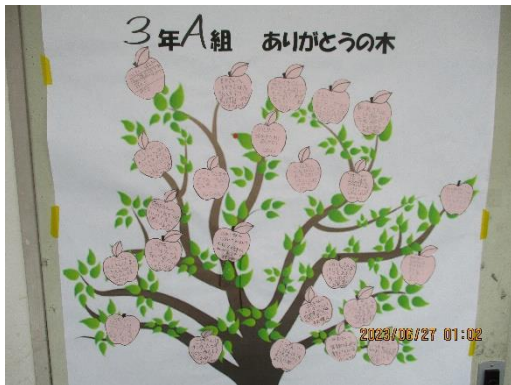
① ありがとうの木 (各学級で)