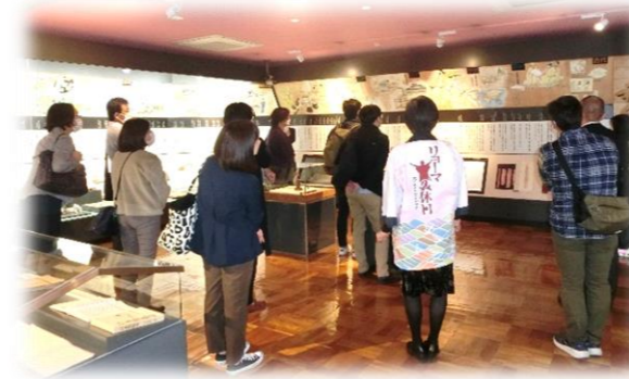
【いの町紙の博物館】

和紙や土佐和紙の歴史と、和紙がどのように使われ、どのような役割を果たしてきたのか、展示物を交えながら紹介してもらいました。