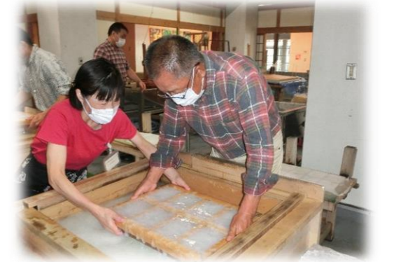
▲ 紙すき体験の様子

和紙や土佐和紙の歴史と、和紙がどのように使われ、どのような役割を果たしてきたのか、展示物を交えながら紹介してもらいました。