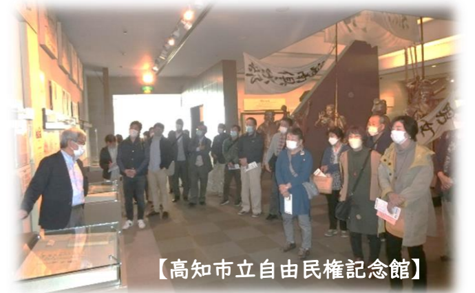
【高知市立自由民権記念館】

自由民権記念館では、自由や市民参政権獲得の歴史を学び、基本的人権の尊重や男女共同参画の社会の実現について理解を深めることができました。