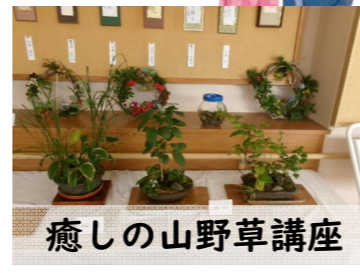
癒しの山野草講座