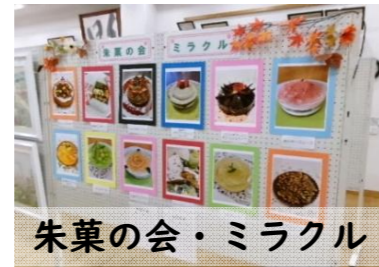
朱萼の会・ミラクル