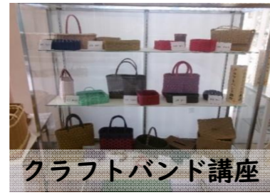
クラフトバンド講座