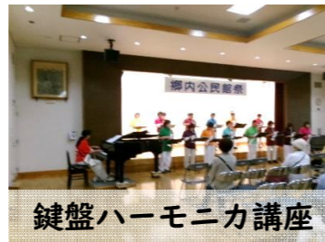
鍵盤ハーモニカ講座