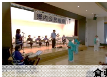
倉敷せとうち民謡会・民踊郷の会・郷内竹唄・郷内民謡