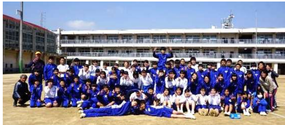
(写真撮影のためマスクを外しています)