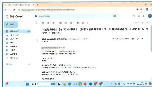
⑥登録アドレスに確認コードが届く