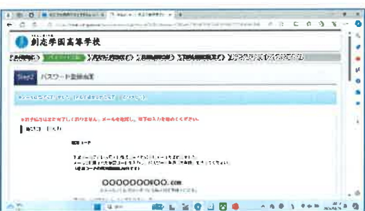
⑦Step2で確認コードを入力下に移動