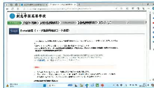
④Step1の画面を下に移動