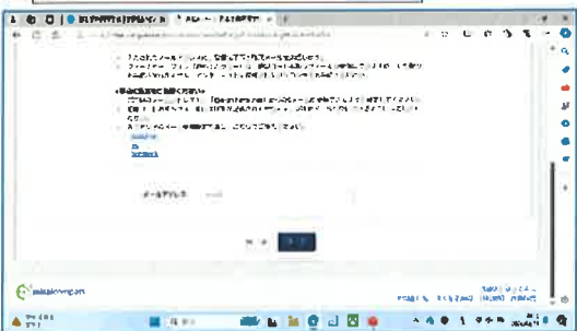
⑤メールアドレスを入力して送信を押す