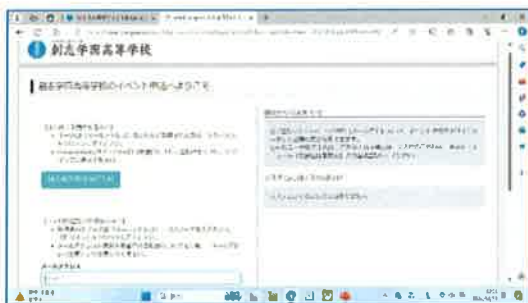
③はじめの方はこちらを押す