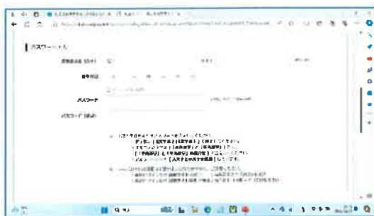
⑧氏名 生年月日 パスワードを設定