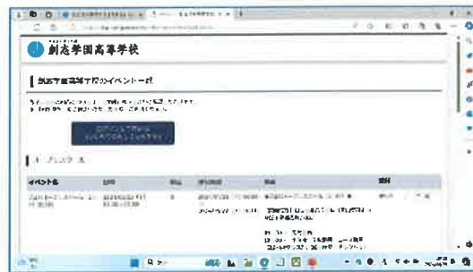
②ログインして申込みを押す