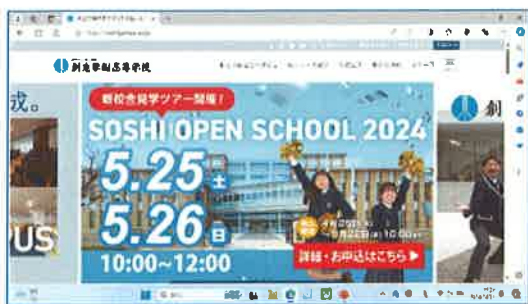
①高校のホームページ