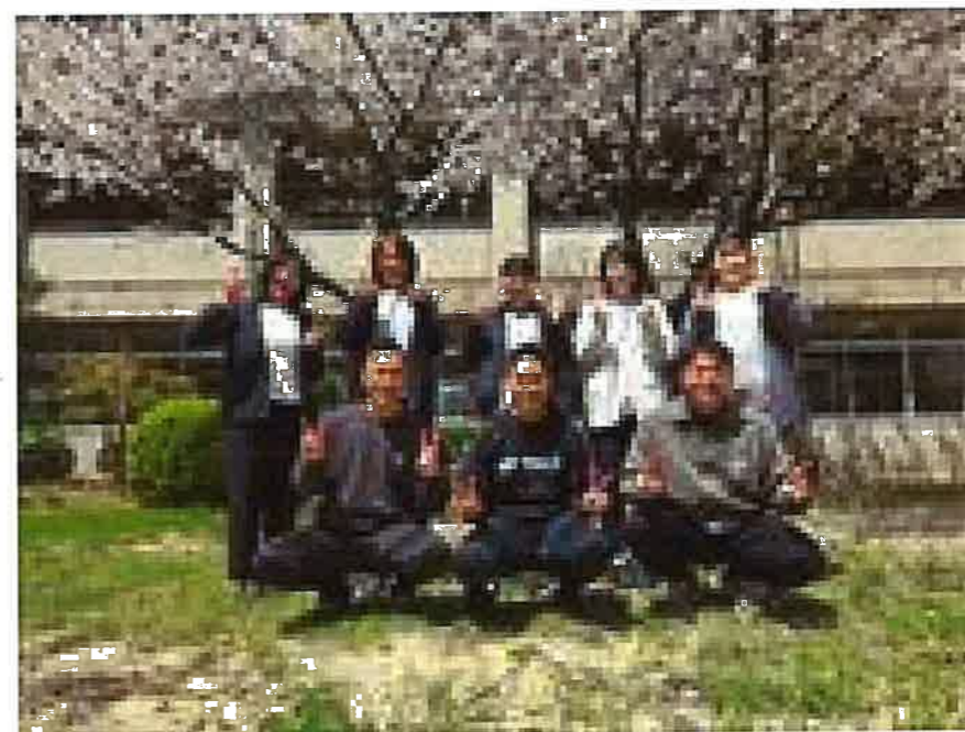
一年団です！一年間よろしくお願ひします！