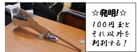
☆発明! ☆ 100円玉と それ以外を 判別する!