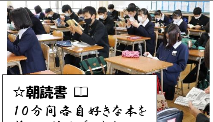
☆朝読書 □ 10分間各自好きな本を 静かに読んでいます。