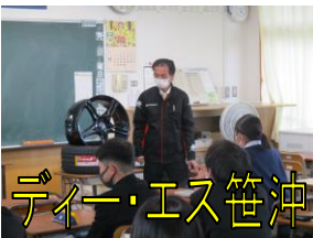
ディー・エス笹沖