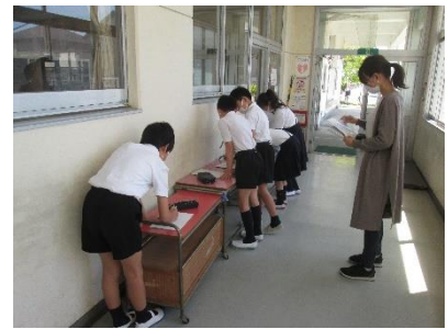
給食委員会の様子