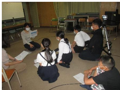
放送委員会の様子