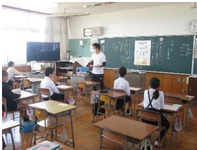
運営委員会の様子