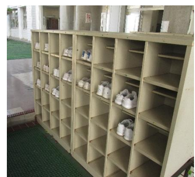
児童のくつばこの様子