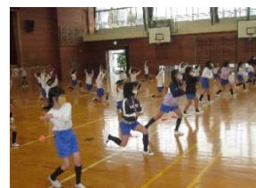
2年生の出し物の様子