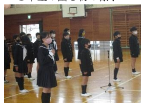
5年生の出し物の様子

<ちょっと一言> 「相手の喜びが自分の喜びに変わったとき、人は本当に幸せになります。」