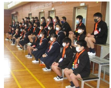
6年生の子ども達の様子

3月2日（火）に6年生を送る会が開かれました。この1年間、琴浦南小学校の機関車として活躍してくれた6年生に、下級生から感謝の気持ちを伝えました。今年度は、新型コロナウイルス感染症対策をとって、全校が体育館に集まることはできませんでしたが、各学年や先生方からの出し物やプレゼントなどがあり、すてきな時間を過ごすことができました。また、中心となって「6年生を送る会」を運営してくれた5年生の子ども達の大きな成長を感じて、とてもうれしかったです。