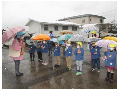
小学校を訪れた和井田保育園児