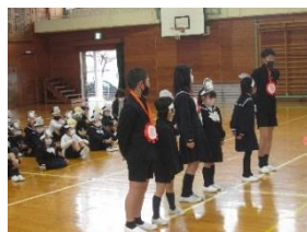
1年生の出し物の様子