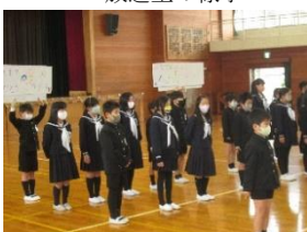
4年生の出し物の様子