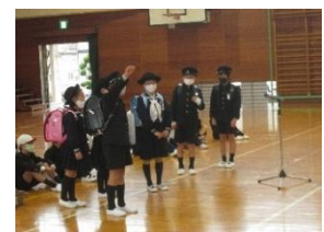
3年生の出し物の様子