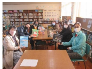
「読み聞かせ」のボランティアの方々