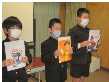
人権図書の紹介の様子