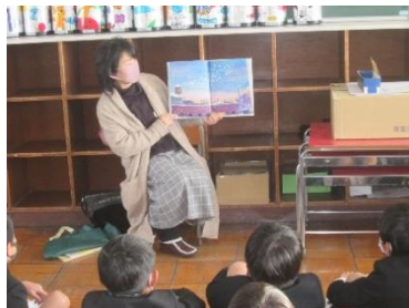
「読み聞かせ」の様子

学校中が、静かに物語の世界に浸り、とてもよい時間が流れましたが、コロナウイルス感染症対策として、今年度は最後の「読み聞かせ」になってしまいました。ボランティアのみなさん、今まで本当にありがとうございました。来年度、ボランティアの方の「読み聞かせ」ができることを祈るばかりです。