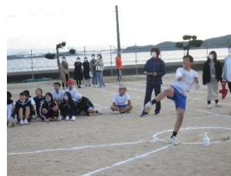
校内陸上記録会の様子