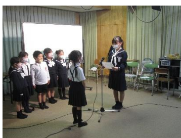
「おそうじ名人」の表彰の様子