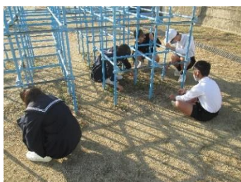
環境委員の活動の様子

環境委員会の子供達が、毎朝、校内をきれいにしようと活動しています。体育館前の掃除や運動場の草抜きなどです。この日は、遊具の下の草抜きをしていました。黙々と一生懸命に草抜きをしている姿は、「琴浦南小学校の機関車」としての自覚を感じました。地道な活動が琴浦南小学校を支えてくれているのだと思います。