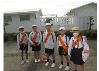
先言後礼みつけ隊（4年）

4年生の子ども達が、自分たちから進んで「先言後礼のあいさつ」の輪を広げようと、毎朝、校門であいさつ運動をしてくれています。「考動」に取り組む子ども達の心の成長を感じてとてもうれしくなりました。