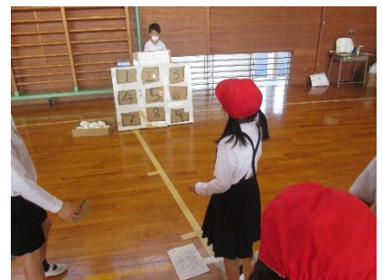
「あそびのひろば」の様子