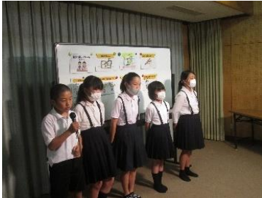
お昼の放送の様子

7月14日(火), 給食委員会の子も達がお昼の校内放送で、「食事の正しいマナー」について全校に呼びかけました。「食事の正しいマナー」の5つのポイントを分かりやすく伝えました。ご家庭でも食事のマナーについて話題にいただければ幸いです。