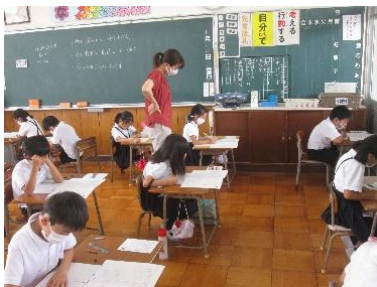
子ども達が取り組んでいる様子

7月18日(土), 3年生から6年生まで学力・学習状況調査を行いました。本年度は, 新型コロナウイルス感染症拡大によって, 6年生の全国学力・学習状況調査は中止されました。しかし, 子ども達の学力・学習状況を把握するためにも必要な調査と考えて実施しました。子ども達の真剣に取り組む姿がとても印象的でした。