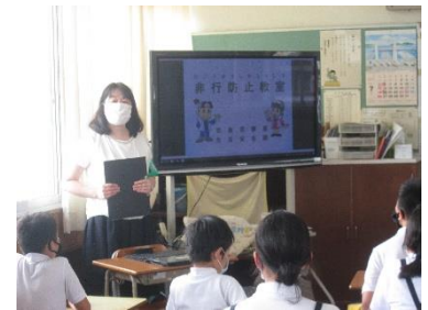
「非行防止教室」の授業の様子