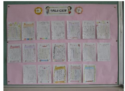
「うれしいことば」（2年生）

ご来校の際は、1階東渡り廊下に掲示していますので、ぜひご覧ください。また、2年生の教室の「うれしいことば」の掲示も紹介します。