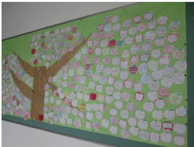
人権の「リンゴ」の木

6月15日（月）から19日（金）まで校内人権週間でした。「よいところ見付け」の取り組みとして、友達のよいところを見付けて、「リンゴの実」に書いて、全校児童で大きな「リンゴの木」を作りました。