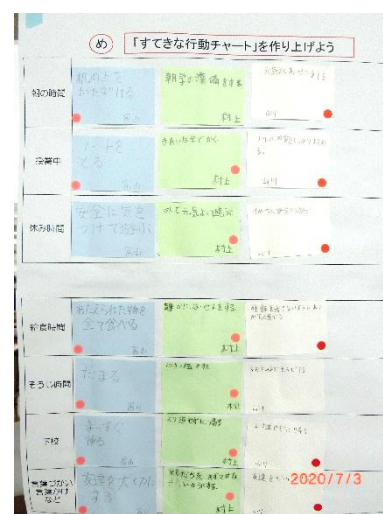
素敵な行動チャート

クラスごとに「人権の花」（友達のよいところを見付けて貼っていく活動）や人権標語、「すてきな行動チャート」