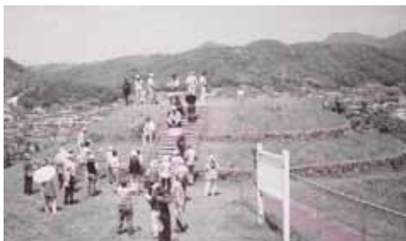
整備された石鏡山1号古墳