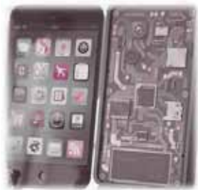
環境省が作成したスマートフォン模型

講師/リサイクル業者 社員 日程/6月20日(土) 10:00~12:00 (全1回) 対象/一般(小学生以上) ※小学生は保護者同伴 定員/30名 受講料/無料 締切/6月6日(土)