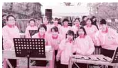
真備町竹のオーケストラ