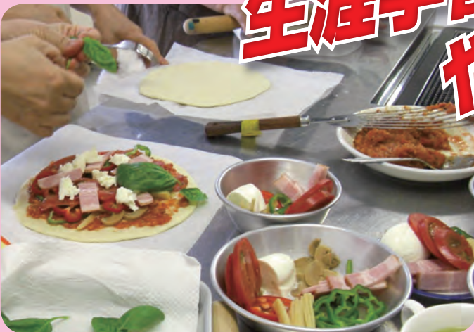
楽しくクッキング! 唐琴公民館