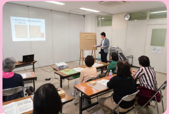
ゼロから始める女性の将棋教室 連島公民館