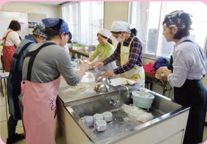
楽しいおいしいパン作り 新田公民館

発行 倉敷市生涯学習推進本部 編集 倉敷市教育委員会 ライフパーク倉敷市民学習センター TEL(086)454-0011 FAX(086)454-0305