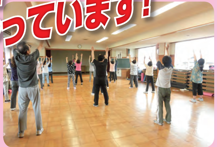
中国健康体操「練功」 玉島北公民館