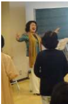
女声のための歌声教室