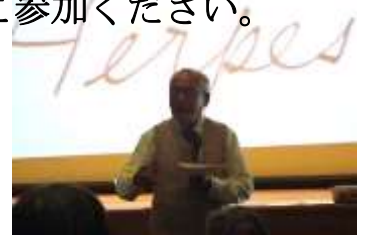
江戸うわさ評判記