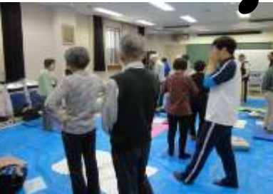
ますます元気アップ介護予防教室