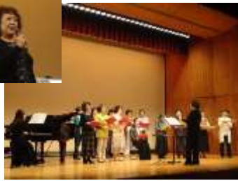
女声のための歌声教室 (講座)