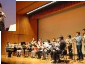
楽しく吹こうりコーダー (講座)