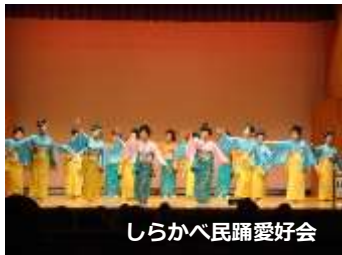
しらかべ民踊愛好会