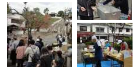
倉敷子ども会連絡協議会

おかげさまで 喫茶・ふるまい・焼きそば 大盛況~!(^)! ありがとうございました!