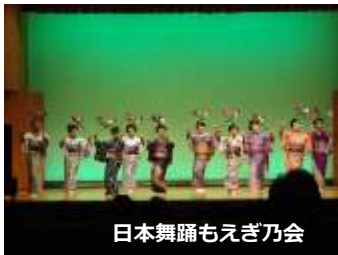
日本舞踊もえぎ乃会