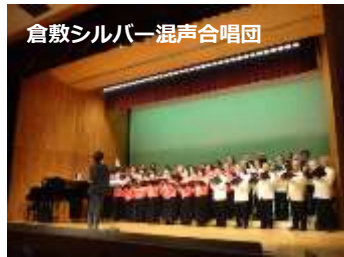
倉敷シルバー混声合唱団