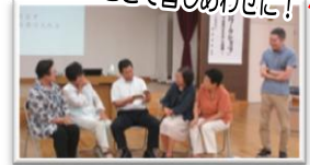
↑実際に演技をしている様子

認知症の方に対する理解・受け止め方・接し方について、講演及びワークショップを実施していただきました。