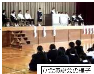
立会演説会の様子

10月28日(水)に、次期生徒会役員を選出するための立会演説会が行われました。どの立候補者も、よりよい船穂中にしていきたいという想いを熱く語りました。