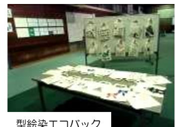
型絵染エコバック