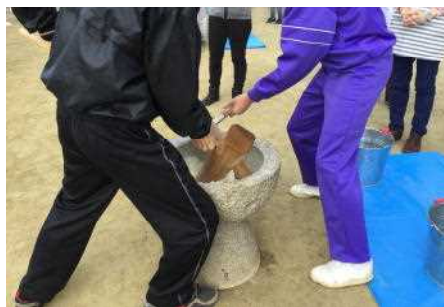
老人クラブの方は年季が入っています。

毎年、この大会には老人クラブなどたくさんの地域の方々やPTAが関わり、餅つきの指導から餅を丸めることまで熱心に指導して下さいます。ほとんどの生徒が初めて杵を持つようで、慣れない手つきで頑張っていました。