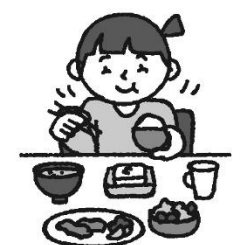
しょうじ バランスのとれた食事