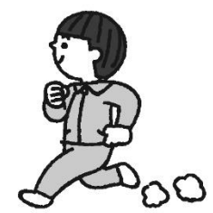
てきど うんどう 適度な運動