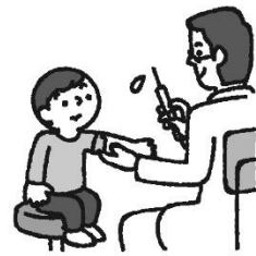
よぼうせつしか 予防接種