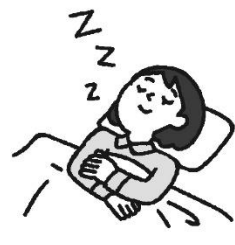
すいみん じゅうふんな睡眠