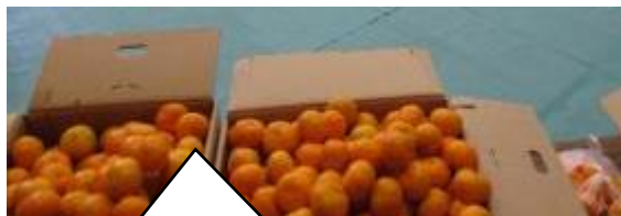
みかんの詰め放題も人気でした！