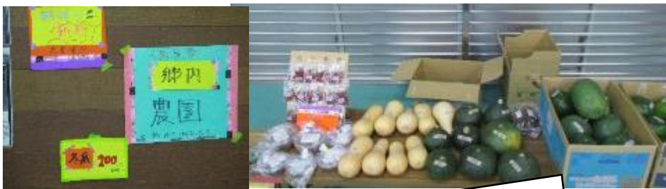
冬瓜やピーナツカボチャ、郷内農園の野菜も登場！