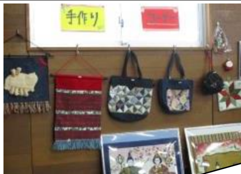
素敵な手作りの作品にも興味深々でした！